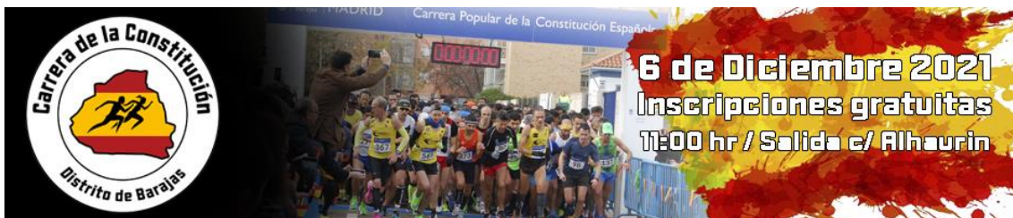
Recorrido 750 m (Infantiles y Alevines)