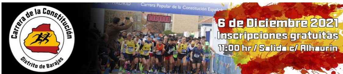
Recorrido 550 m (Benjamines y Prebenjamines)